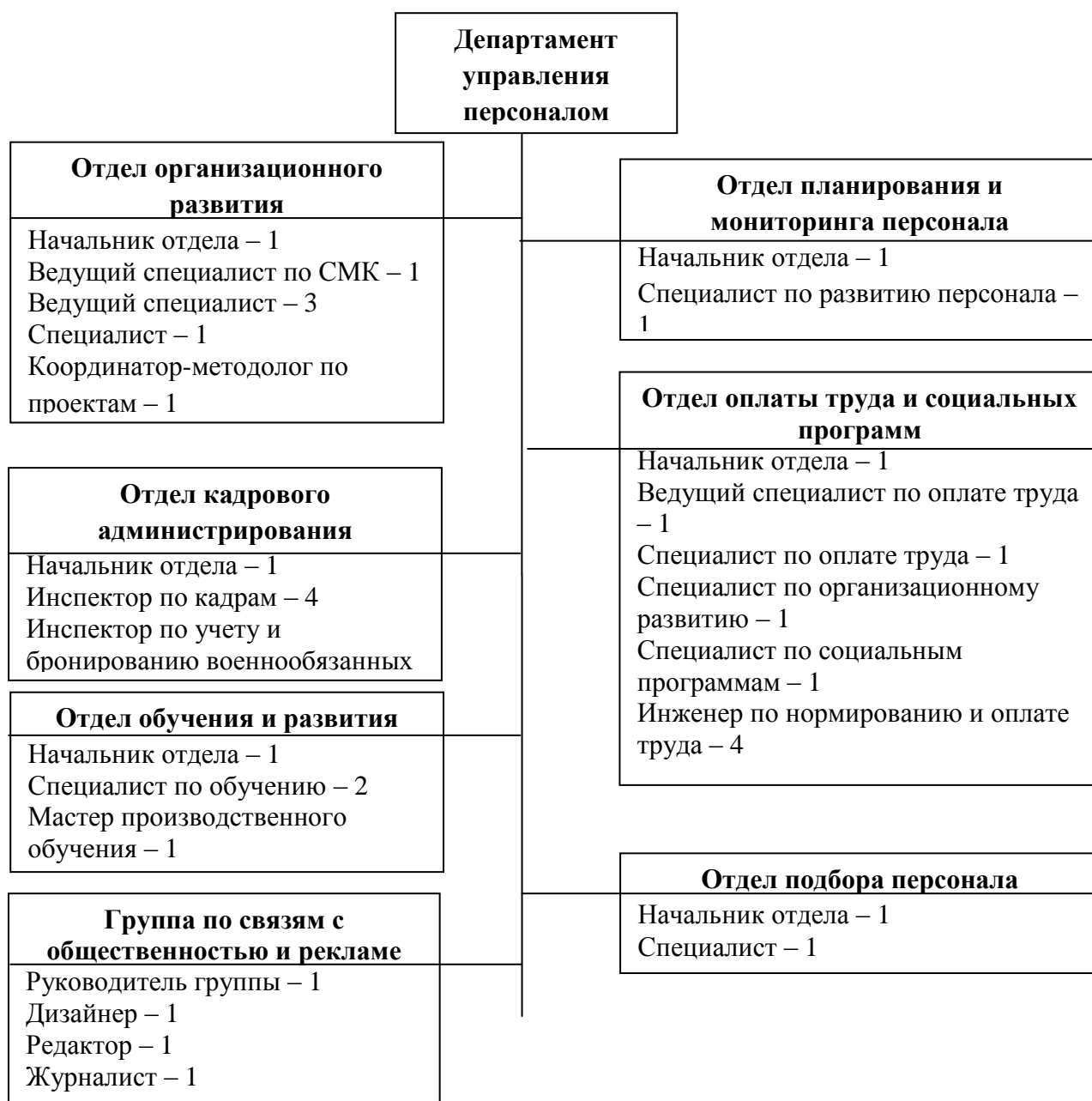
Рисунок 2.2 «Организационная структура департамента управления персоналом АО «Управляющая компания ГК «ГОТЭК»»

Для того чтобы провести анализ системы управления персоналом департамента на основе положения о департаменте управления персоналом, представленного в приложении 3, были выделены цели, задачи и функции данного департамента.