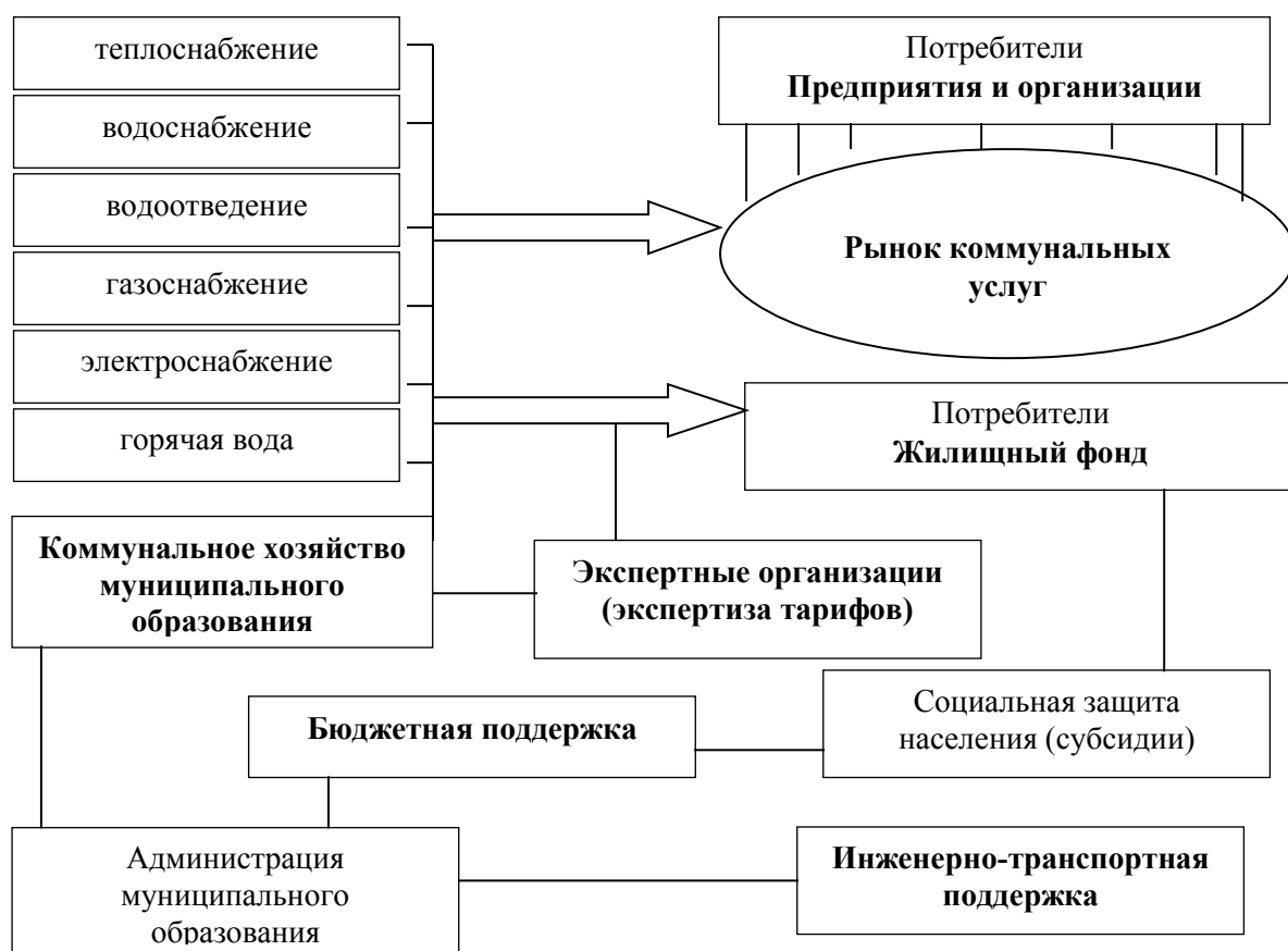
Рис. 2. Социальная модель управления жилищно-коммунальным комплексом муниципального образования

К особенностям социальной модели стоит отнести организацию отдельного рынка коммунальных услуг для предприятий и организаций на основе экономически обоснованных тарифов и цен, в то же время тарифы для населения устанавливаются исходя из сложившегося уровня доходов домохозяйств в данном муниципальном образовании.