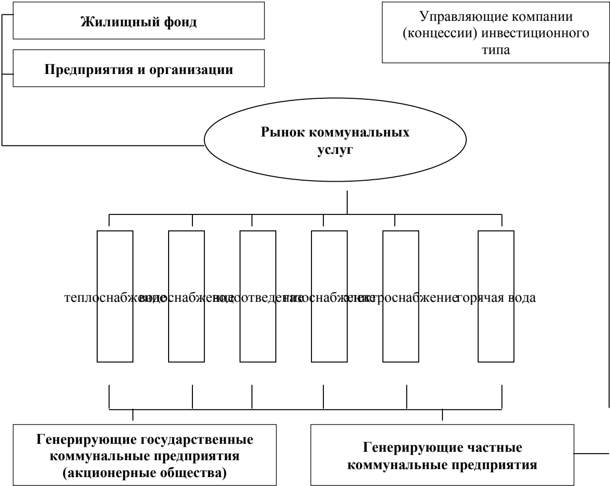
Рис. 3. Рыночная модель управления жилищно-коммунальным хозяйством муниципального образования

2. Рыночная модель управления коммунальным хозяйством муниципального образования (рис. 3) предусматривает полный переход на систему договорных отношений при производстве и потреблении коммунальных услуг. Здесь рассматриваются схемы и механизмы функционирования коммунального хозяйства, при которых обеспечиваются интересы всех субъектов коммунальных отношений.