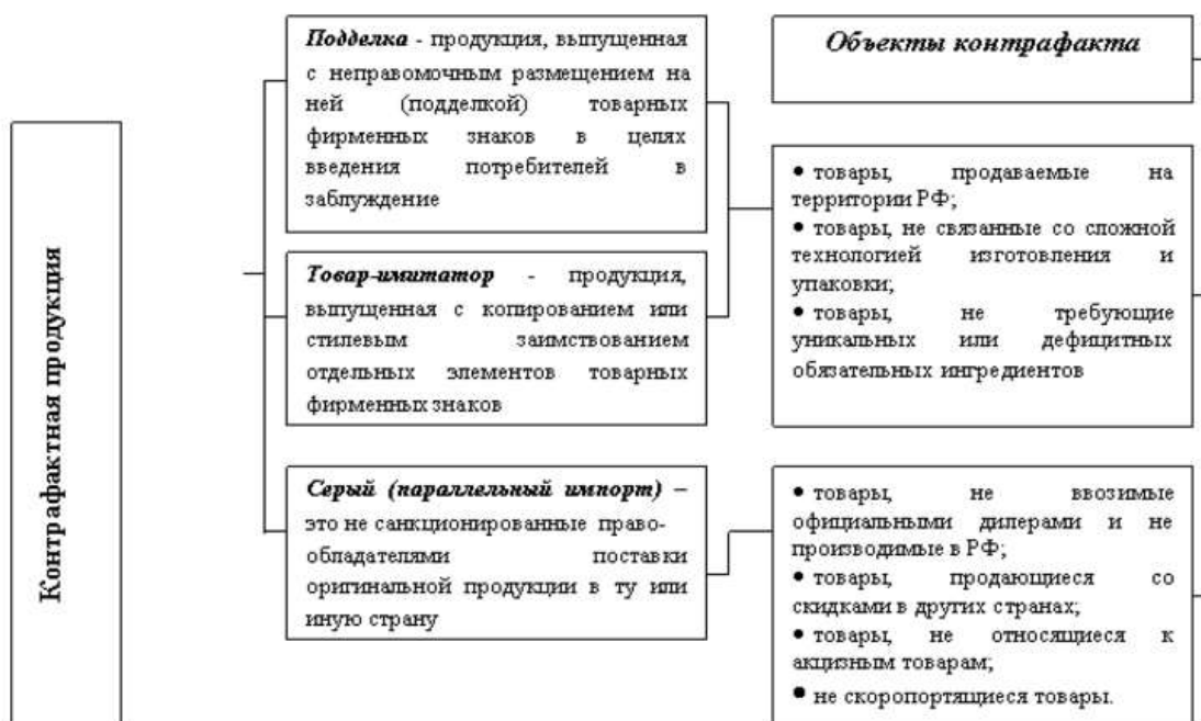
Рисунок 1. Классификация контрафактной продукции

легко затеряться среди изобилия продуктов и множества компаний. Подделывают тот продукт, который уже завоевал рынок и имеет высокую лояльность потребителей. Самые известные бренды содержат наибольший соблазн для контрафактного дублирования.