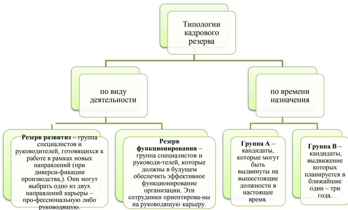
Рис. 1.1 «Типологии кадрового резерва»

Можно выделить несколько типологий кадрового резерва (Рисунок 1.1.) зависимости от целей кадровой работы можно использовать либо одну, либо другую типологию.