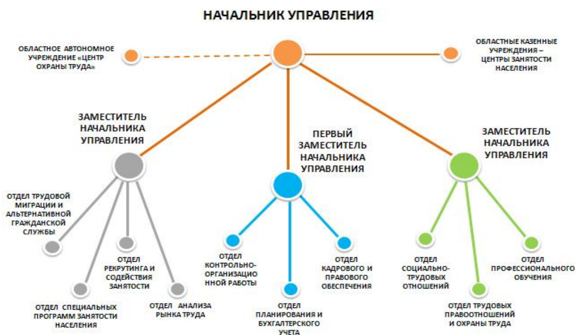
Рис. 2.1 «Схема организационной структуры управления»

На основании ежегодного мониторинга потребности предприятий и организаций всех форм собственности в квалифицированных рабочих кадрах и специалистах (мониторинг проводит Управление по труду и занятости населения вместе с органами местного самоуправления) формируется ежегодный заказ-потребность в рабочих кадрах и специалистах в разрезе отраслей экономики по муниципальным районам с указанием конкретных профессий и специальностей, т. е. формируется целевой заказ на подготовку кадров.