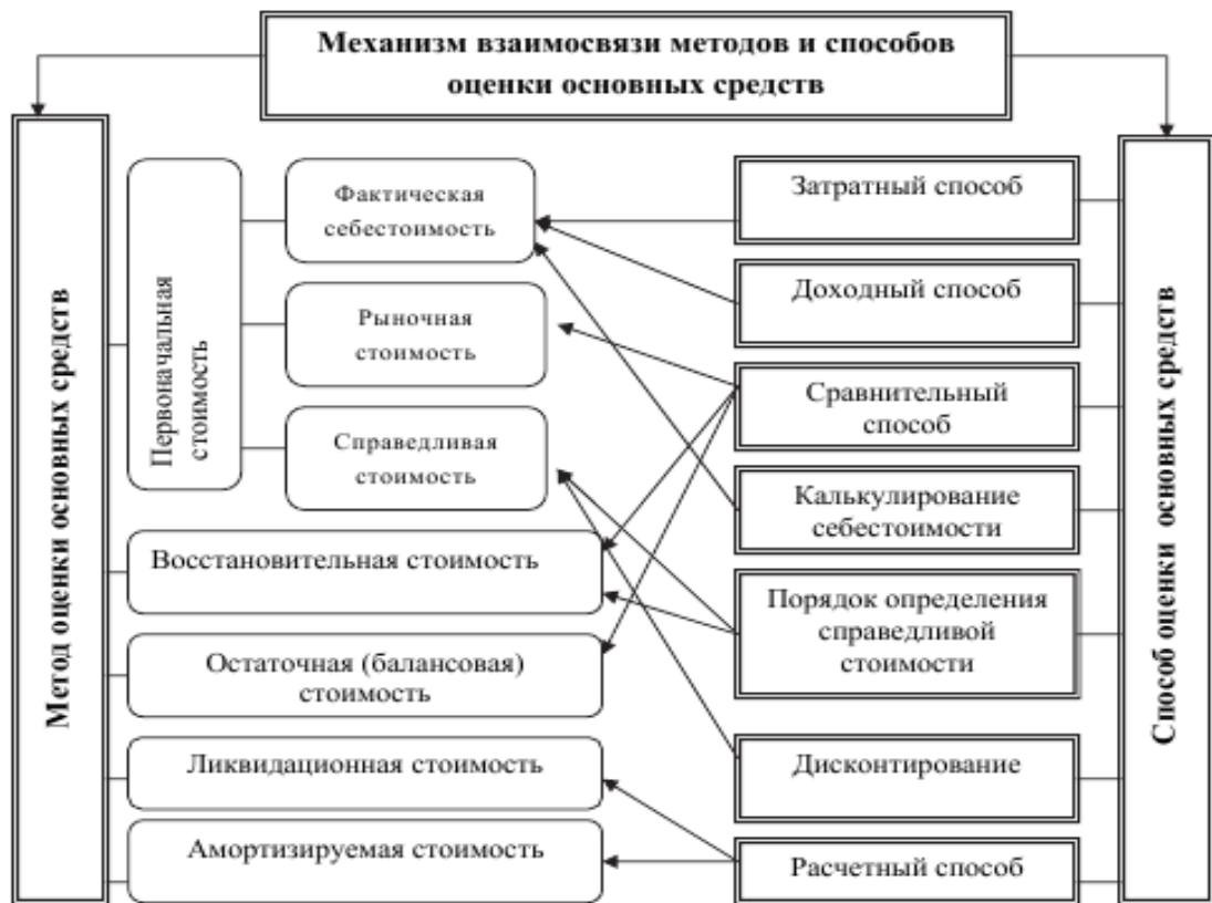
Рис.1.3. Механизм взаимосвязи методов и способов оценки основных средств

закрепленных в МСФО ОС 19 «Оценочные обязательства, условные обязательства и условные активы». Так, если влияние фактора времени на стоимость денег существенно (т. е. оценочное обязательство является долгосрочным), сумма оценочного обязательства должна равняться дисконтированной величине расходов, которые ожидается понести для погашения обязательства. Следовательно, данное требование вызывает необходимость применения дисконтированной оценки стоимости основных средств.[1]