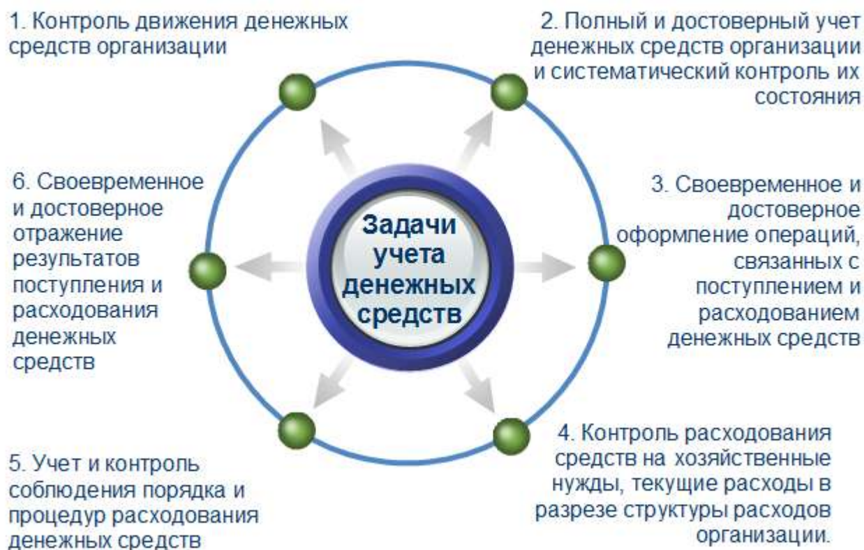
Рис.2. Задачи бухгалтерского учета денежных средств

Задачи бухгалтерского учета денежных средств представлены на рисунке.