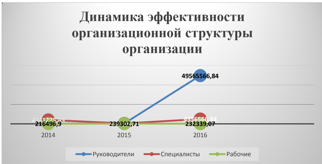
Рис. 2.3 Динамика эффективности организационной структуры предприятия

Из диаграммы наглядно видно, что эффективность организационной структуры имеет положительную динамику в основном среди руководящего состава, который стабильно работает практически с момента открытия организации. Эффективность среднего звена и рабочего персонала имеет плавающую динамику. Данное обстоятельство можно интерпретировать как следующий тезис: эффективность структуры тем лучше, чем она стабильней. Таким образом, чрезмерный рост текучести кадров, будет вызывать негативные влияния на всю организационную среду в целом.