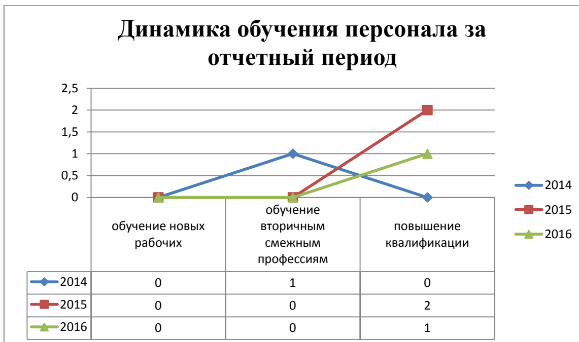
Рис. 2.4 Динамика обучения персонала за отчетный период 2014-2016гг.

На рисунке видно, что повышению квалификации присутствует на предприятии, но для данной численности персонала, 1-2 человека в год-это очень низкий показатель.