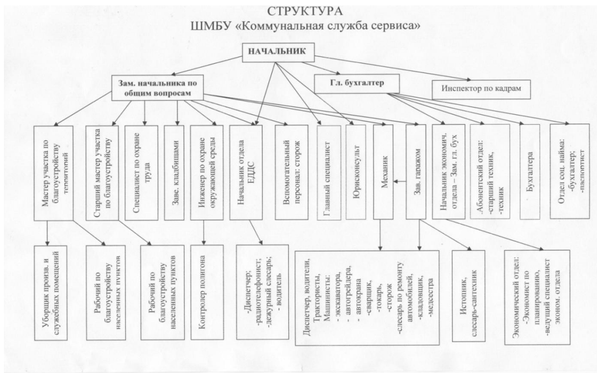
Рис. 2.1. Организационная структура организации

Организационная структура предприятия представлена следующей архитектурой (см. рисунок 2.1).