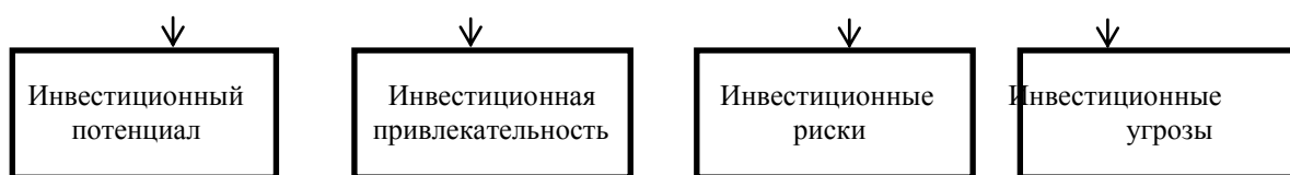
Рис. 1.2. Факторы инвестиционной безопасности

К позитивным можно отнести инвестиционный потенциал, включающий в себя финансовые, трудовые, производственные и природные ресурсы региона и инвестиционную привлекательность. К деструктивным относятся инвестиционные риски и инвестиционные угрозы.