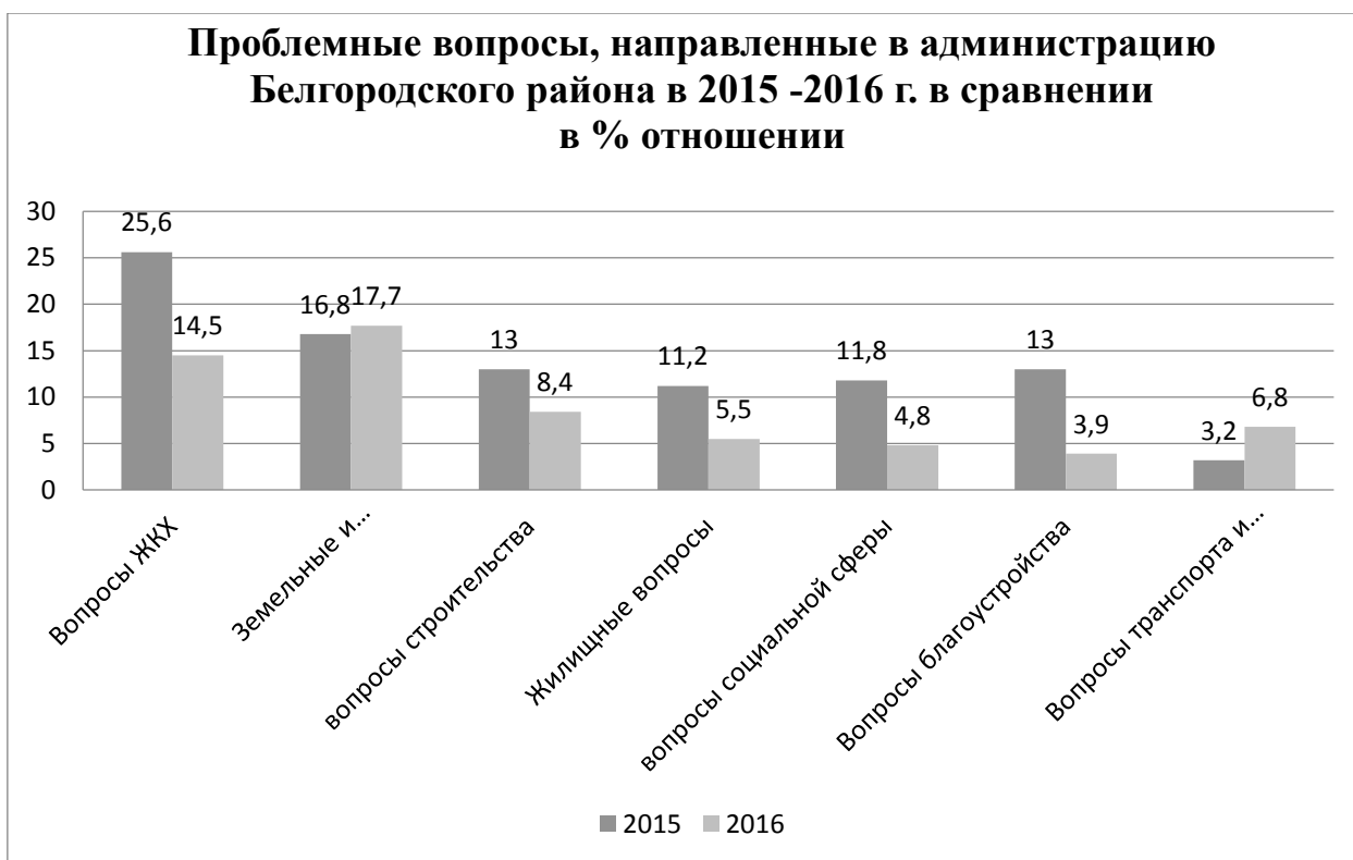
Рис. 1. Соотношение обращений граждан по проблемным сферам за 2015–2016 гг.

Таким образом, на сегодняшний день, обращения граждан в органы местного самоуправления является практически единственной формой активности граждан за исключением единичных случаев проявления других форм активности (добровольчество, участия в акциях и т.д.), которые, как правило, имеют не системный характер. В тоже время Устав муниципального района, закрепляет и возможность иных форм гражданской активности, так в Уставе отмечается, что: «Наряду с перечисленными в настоящей статье формами непосредственного осуществления населением местного самоуправления и участия населения в осуществлении местного самоуправления граждане вправе участвовать в осуществлении местного самоуправления в иных формах, не противоречащих Конституции Российской Федерации, федеральным законам и законам Белгородской области» 1 .