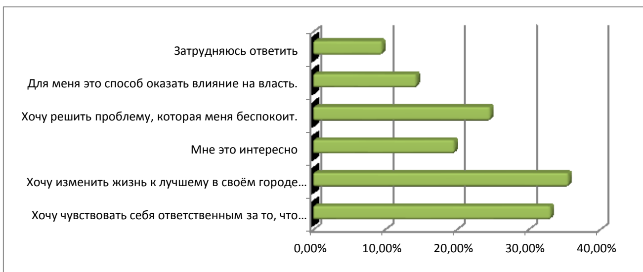
Рис. 3. Распределение ответов на вопрос: «Почему Вы хотели бы участвовать в решении проблем, возникающих в вашем населенном пункте?»

Что касается основных мотивов участия, то среди них преобладают социально ориентированные мотивы, так большинство граждан отметили, что их участие в местном самоуправлении позволит им изменить жизнь в своем населенном пункте к лучшему (35,50%), чувствовать себя ответственным за происходящее в муниципалитете (33,02%), решить интересующие проблемы (24,60%). Отметим, что только для 14,30% опрошенных гражданский активизм является способом оказать влияние на власть (См., Рисунок 3). В целом, заметим, что преобладание общественных мотивов является важнейшим условием развития «здоровой» конструктивной гражданской активности на местном уровне, и предполагает ориентацию граждан на коллективное действие, совместное решение общественно–значимых проблем и задач.