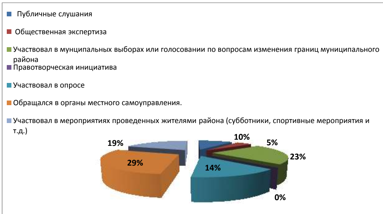
Рис. 4. Основные формы активности граждан в Белгородском районе Белгородской области

местного значения ограничивается 3 основными формами носящими, как правило, опостредованный характер: обращение в органы местного самоуправления (34,60%), выборы (27,40%), участие в субботниках и благоустройстве территории (23,30%). (см. Рисунок 4).