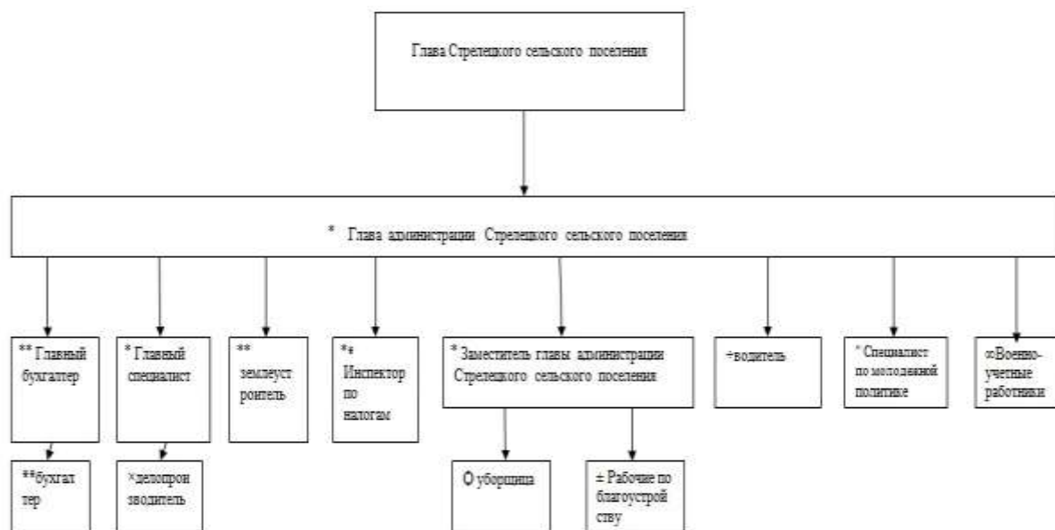
Рис. 2. Структура администрации Стрелецкого сельского поселения

В структуре администрации Стрелецкого сельского поселения выделен отдельный специалист, отвечающий за реализацию молодежной политики на территории поселения.