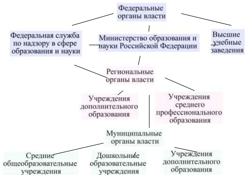
Рис. 2. Структура управления образованием Российской Федерации

На сегодняшний момент структура управления образованием выглядит следующим образом: