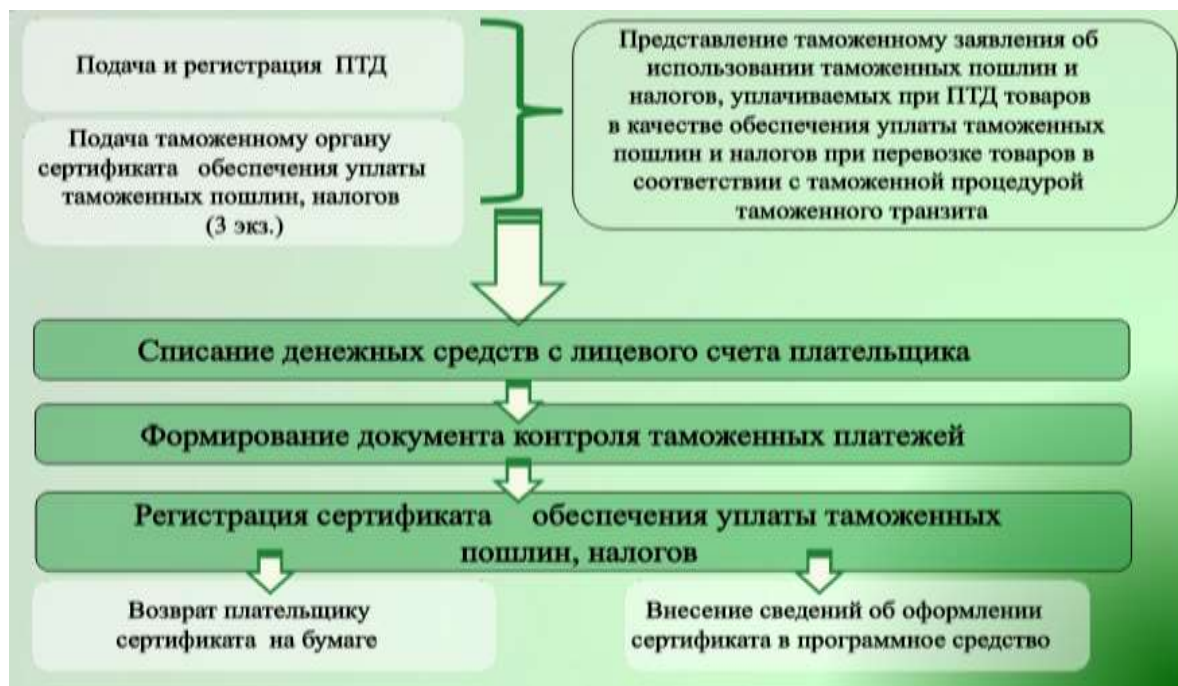
Рис. 3. Технология использования обеспечения таможенного транзита при предварительном декларировании товаров

В регион деятельности Белгородской таможни в 2016 году поступило – 50112 партий, уменьшение к 2015 году на 12,3 %, за 2015 год – 57156.