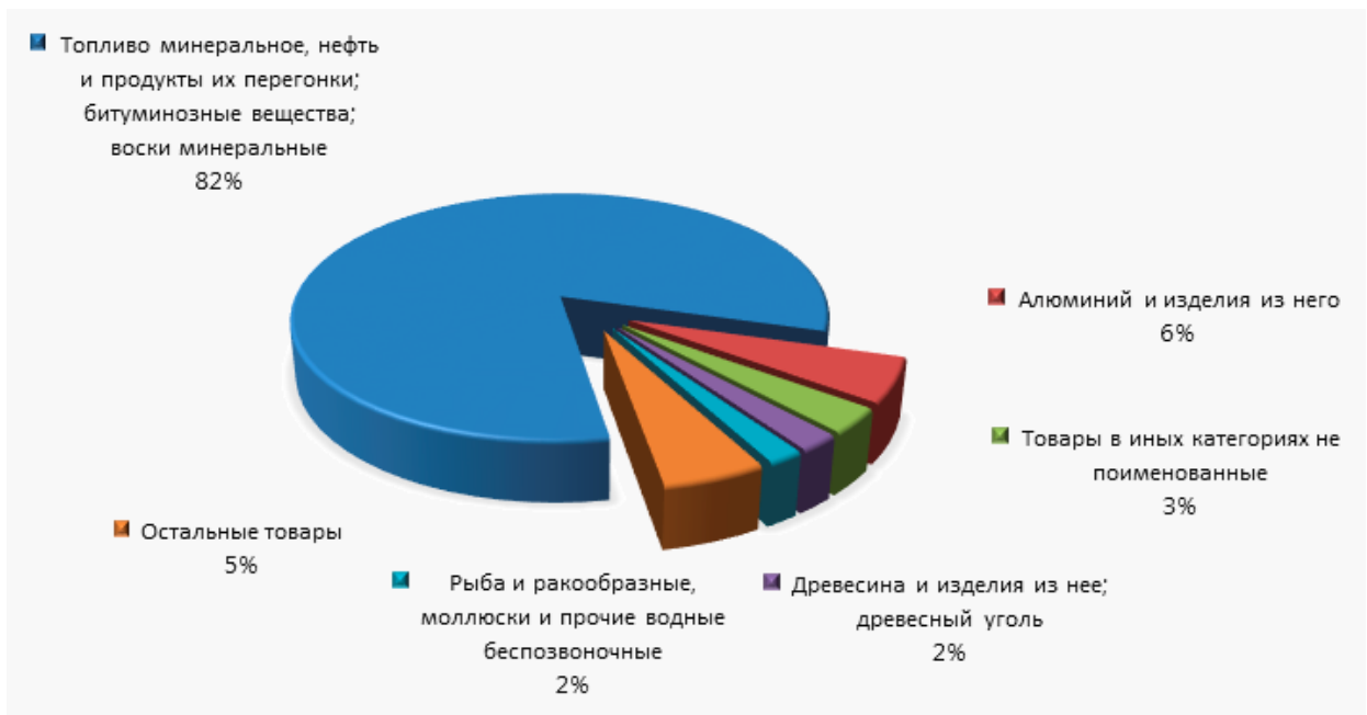
Рис.2.2. Товарная структура российского экспорта в Японию за 2015 год

Из рисунка видно, что основная доля российского экспорта в Японию приходится на (прил. 4):