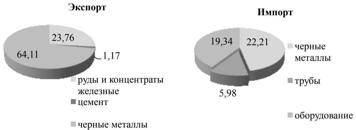
Рис. 2. Товарная структура внешней торговли в 2014 году

В 2015 году среди экспортных товаров наибольший удельный вес стоимости имели чёрные металлы (65,56 % общего объема экспорта), руды и концентраты железные (17,12 % общего объема экспорта), оборудования и механические устройства и их части (1,23 % общего объема экспорта).