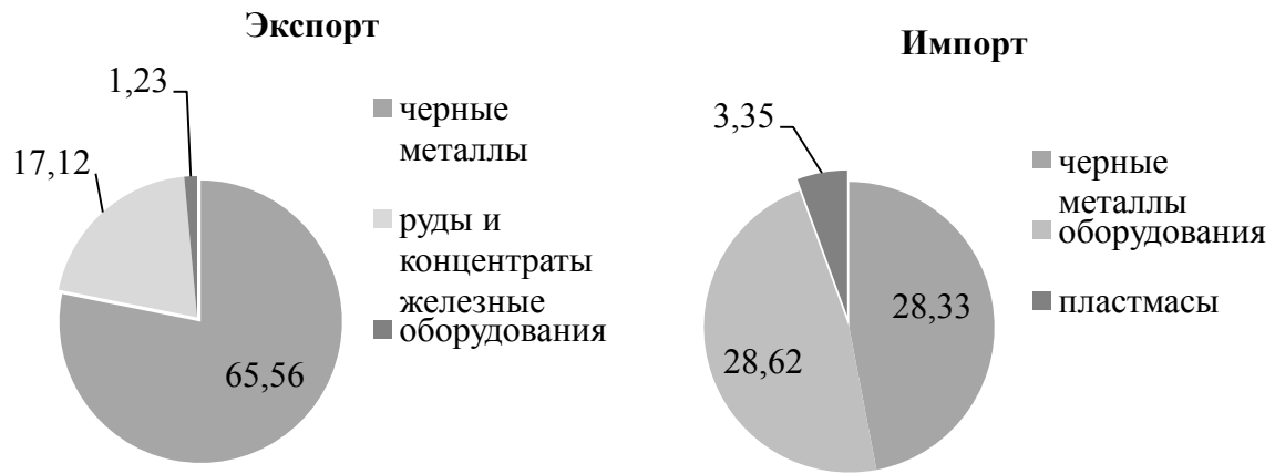
Рис. 3. Товарная структура внешней торговли в 2015 году

В 2016 году наибольший удельный вес (по стоимости) среди экспортных товаров имели руды и концентраты железные (16,65% общего объема экспорта), чёрные металлы (66,02% общего объема экспорта). Чёрные металлы (34,97%), оборудование, механические устройства и их части (19,22%), трубы (4,31%), фармацевтические продукты (3,94%) являются основными товарными группами импорта.