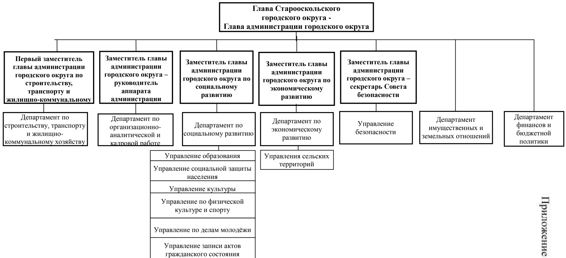
Схема структуры администрации Старооскольского городского округа

Приложение к решению Совета депутатов Старооскольского городского округа от 17 марта 2016 г. № 407