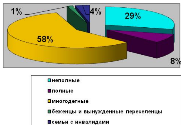
Диаграмма 2.1. Категории семей, участвовавших в программе социальной адаптации в 2016 г.

При этом следует отметить, что в 2016 году в программу социальной адаптации семей, находящихся в трудной жизненной ситуации вступило 70 семей, что на 44% больше, чем в 2015 году.