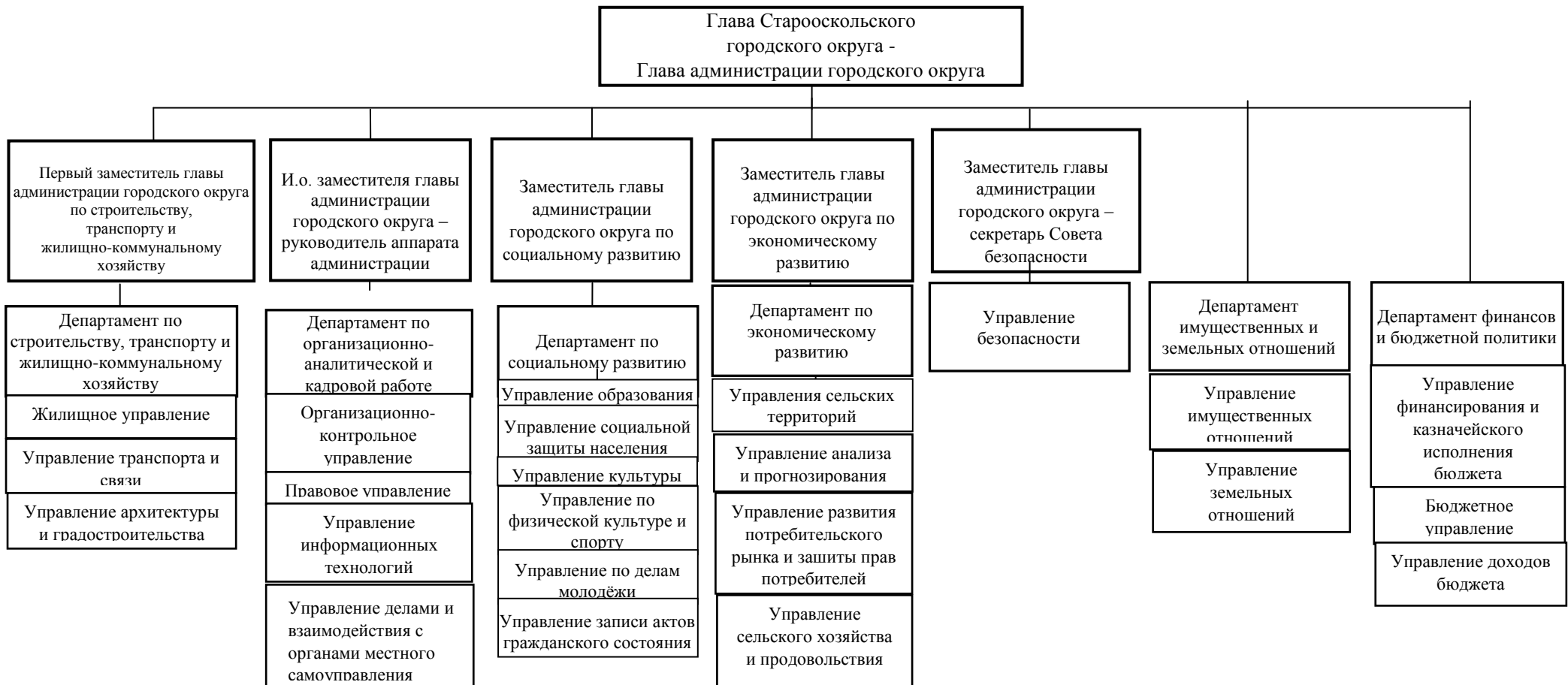
Схема структуры администрации Старооскольского городского округа

Приложение к решению Совета депутатов Старооскольского городского округа от 17 марта 2016 г. № 407