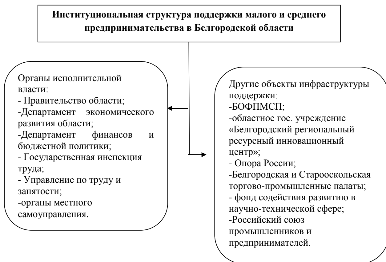
Рисунок 1.1. Структура поддержки малого и среднего предпринимательства в Белгородской области

Рассмотрим институциональную структуру поддержки малого предпринимательства в Белгородской области (Рисунок 1.1).