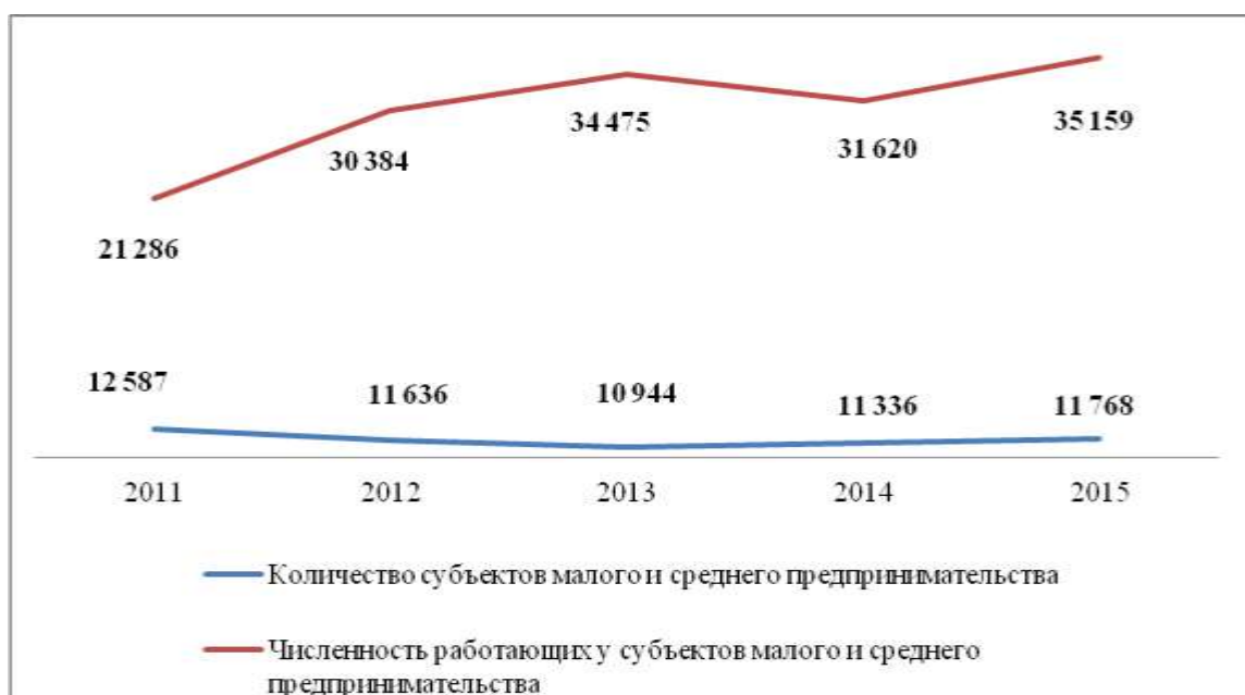
Рисунок 2.1. Динамика развития малого и среднего предпринимательства на территории Старооскольского городского округа за 2011-2015 годы.

В целом, динамика развития малого и среднего предпринимательства на территории Старооскольского городского округа за 2011-2015 годы представлена на рисунке 2.1.