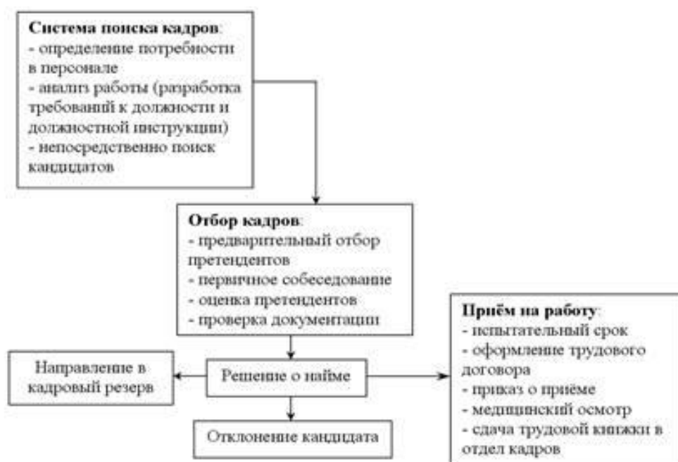
Рис. 1.1 «Процедура подбора, отбора и найма»

Общая схема процедуры подбора, отбора и найма представлена на рисунке 1.1.