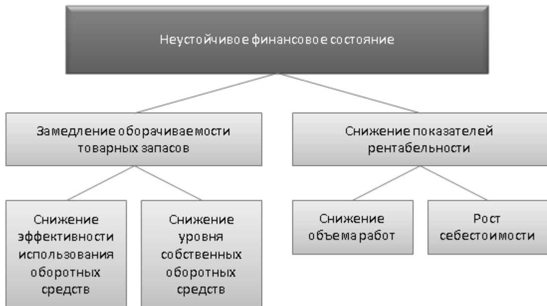
Рисунок 2.3.1 – Дерево проблем финансового состояния организации

Итак, для того чтобы разработать мероприятия по укреплению финансового состояния, нам необходимо определить причины дестабилизации финансового состояния организации. Для этого следует составить дерево проблем (см. рис. 2.3.1).