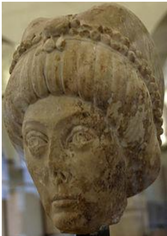
Рис. 5. Голова императрицы Феодоры. Каstellо Сфорцеско, Милан.