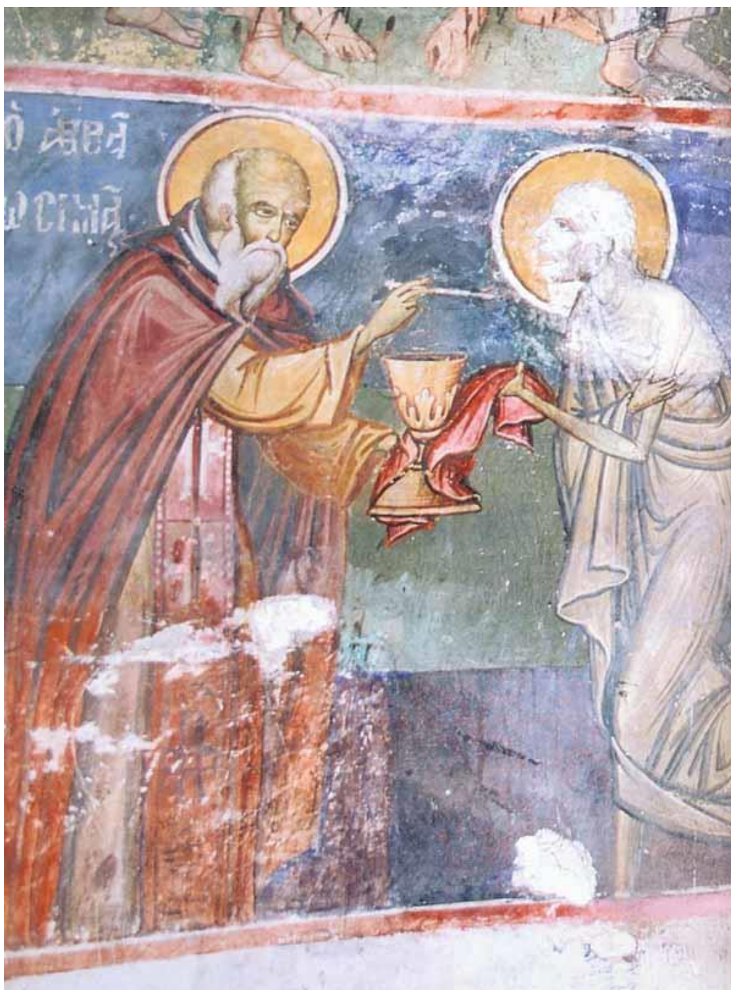
Рис. 3. Преподобная Мария Египетская. Фреска. XVII. Причастие. Афон.