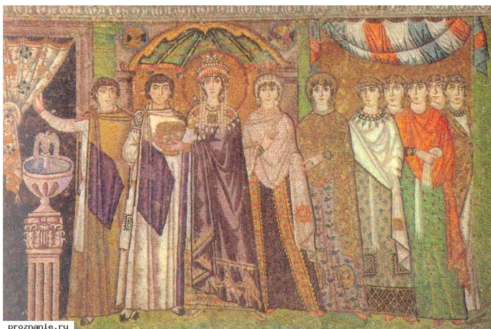
Рис. 6. Императрица Феодора со свитой. Мозаика южной стены апсиды церкви св. Виталия. 546-548 гг. Равенна.