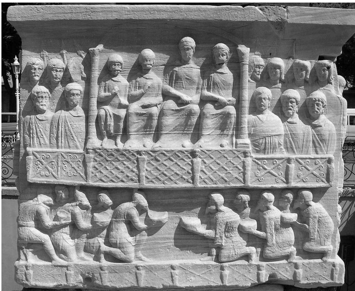
Приложение 2. Пьедестал Египетского обелиска (Обелиск Феодосия). 4 в. н.э. 116 .