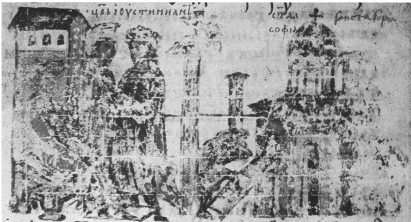
Приложение 8. Строительство Святой Софии. Миниатюра из хроники Константина Манассии. 12 век н.э. 122