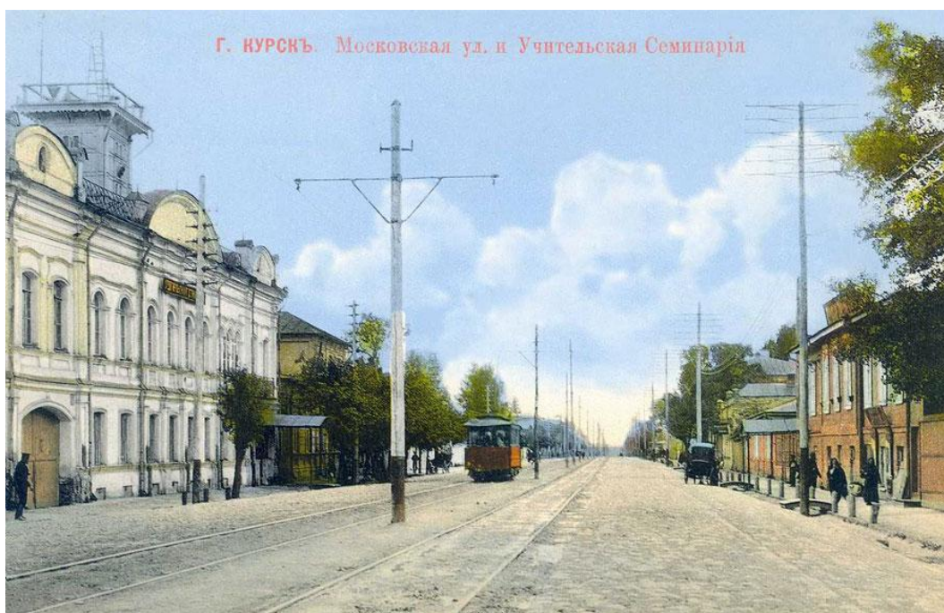
Рис. 11. Учительская семинария г.Курска