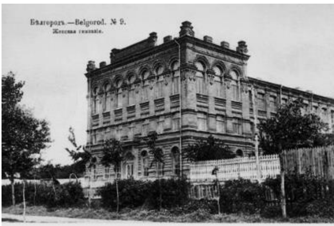
Рис. 4. Женская гимназия. Белгород