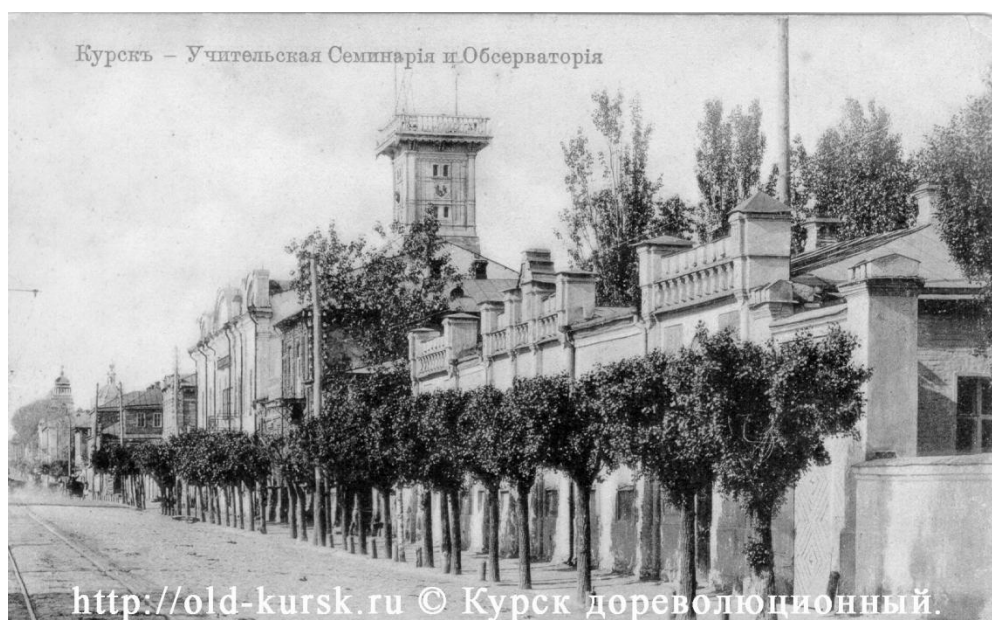
Рис. 10. Учительская семинария и Обсерватория г. Курска