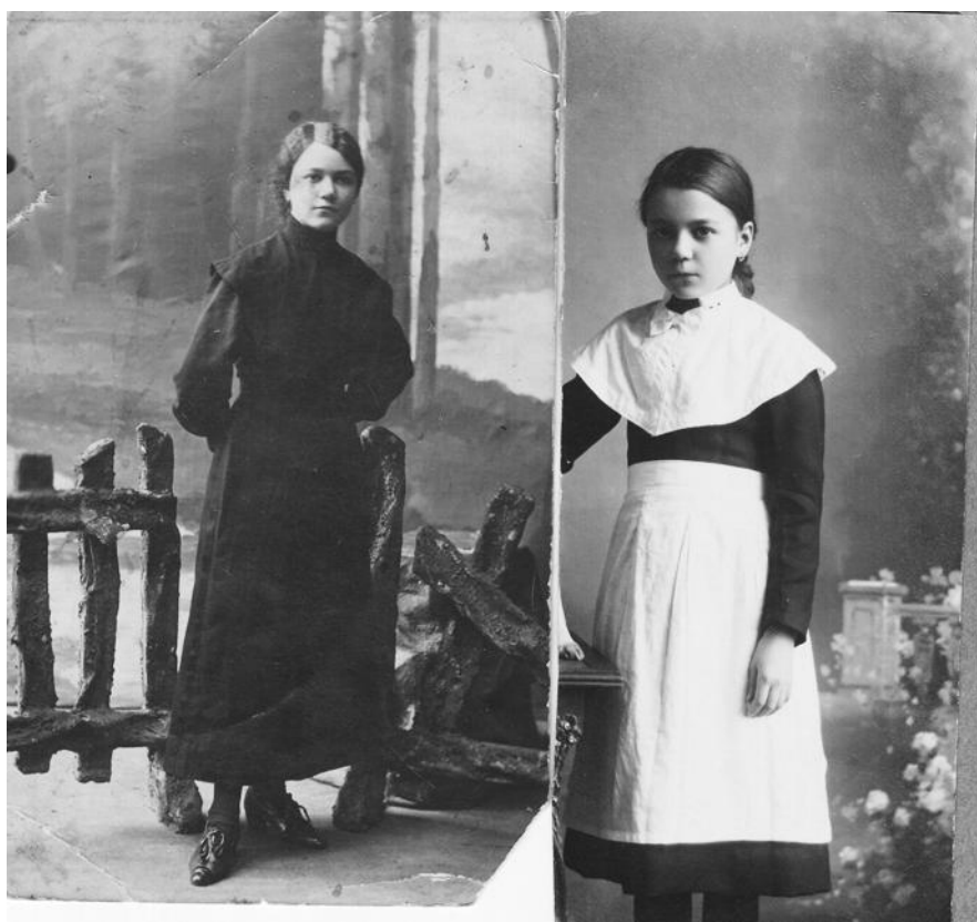
Рис. 8. Курская гимназистка