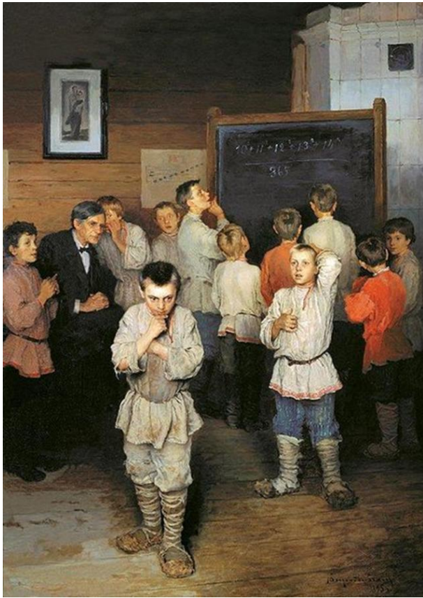
Рис. 1. Н.П. Богданов-Бельский «Устный счет. В народной школе С.А.Рачинского». 1895 г.