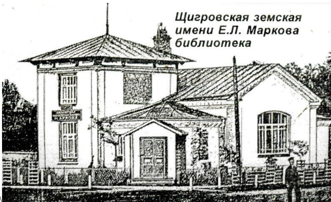
Рис. 12. Щигровская земская имени Е.Л. Маркова библиотека