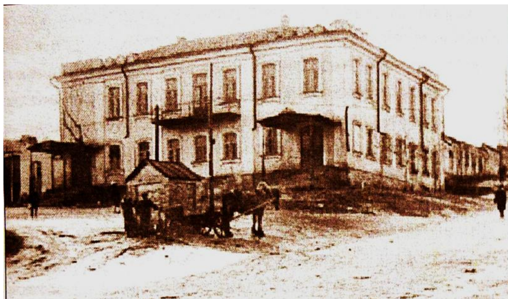
Рис. 9. Частная гимназия Н.Н. Поповой (до 1917 года) в Рыльске