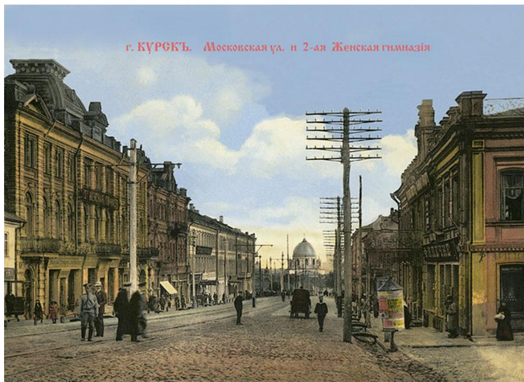
Рис. 7. 2-ая женская гимназия г. Курска