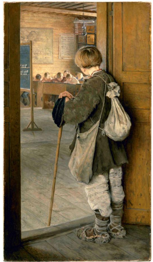
Рис. 2 Н.П. Богданов-Бельский «У дверей школы». 1897 г.