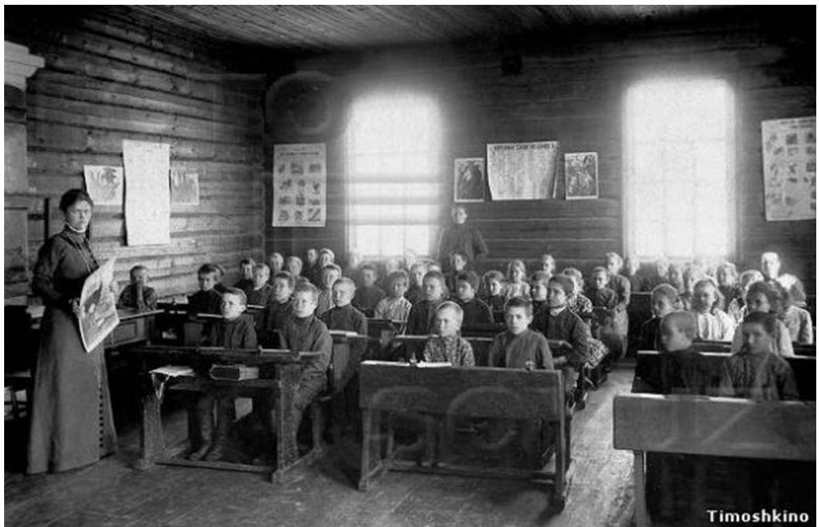
Рис. 3. Занятия в сельской школе конца XIX века