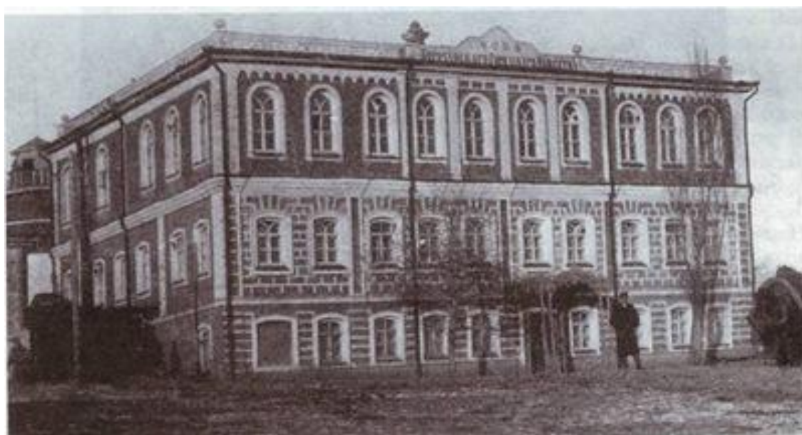
Рис. 5. Дом Корочанского городского общества, где размещалась женская прогимназия