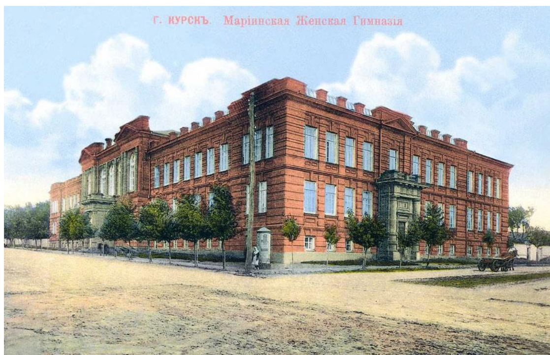
Рис. 6. Мариинская женская гимназия г. Курска