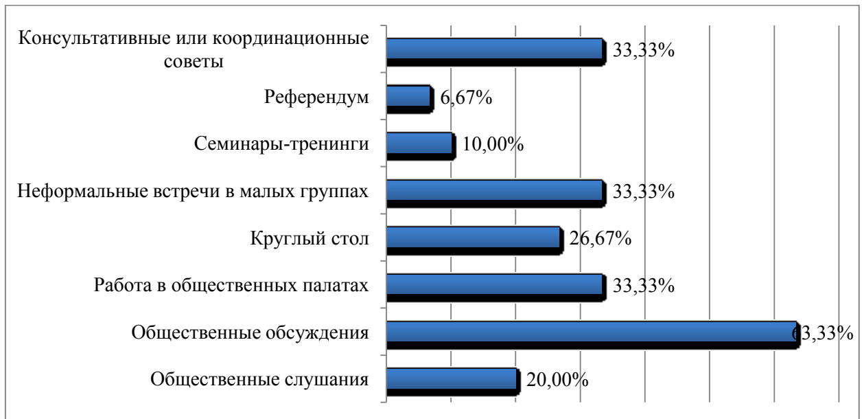
Рис. 3. Распределение ответов на вопрос: «Выделите наиболее эффективные формы вовлечения общественности в процесс выработки совместного решения?»

К наиболее эффективным формам вовлечения общественности в процессе выработки совместных решений эксперты относят общественные обсуждения, работу в общественных палатах, неформальные встречи в малых группах, консультативные и координационные советы (рисунок 3). Также респонденты выделяют работу в экспертных сообществах, которые концентрируются на изучении развития гражданского общества, реализации технологии общественного участия.