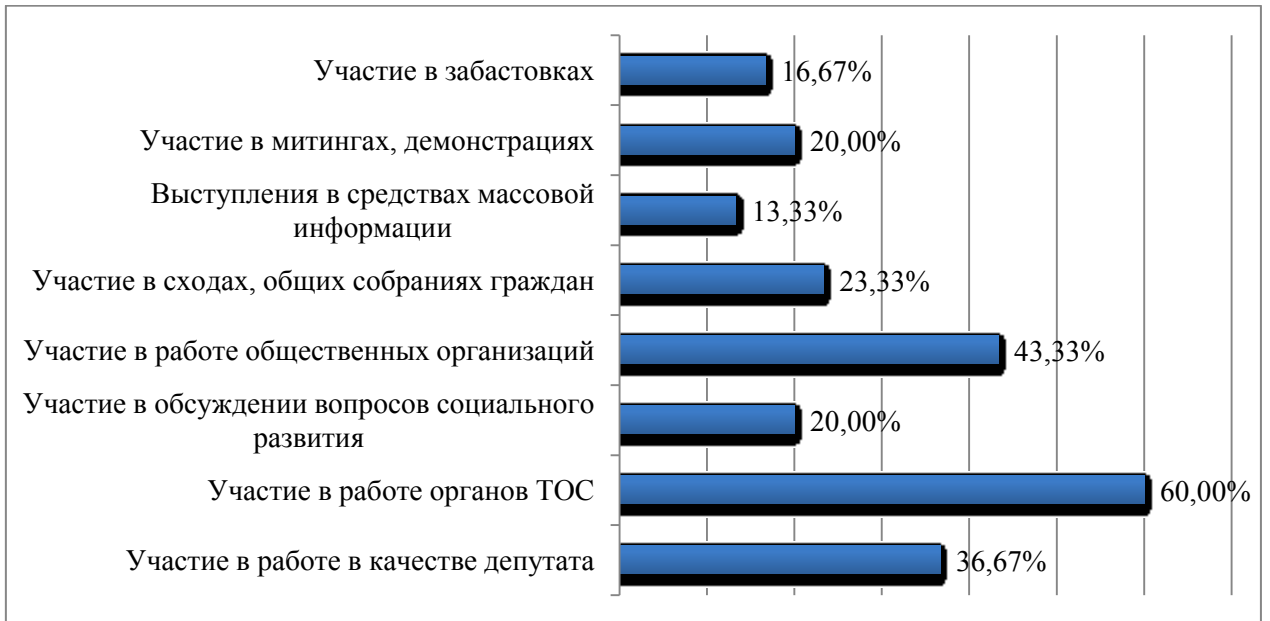
Рис. 2. Распределение ответов на вопрос: «Какие формы общественного участия являются, на Ваш взгляд, наиболее полезными и конструктивными?»

Немаловажным является определение уровня информированности населения о деятельности местных органов власти. По мнению экспертов, население информировано достаточно (63,33%), однако, зачастую информация не отвечает запросам граждан. Не достаточным информирование населения считает треть респондентов (33,33%), и лишь 3,33% из числа опрошенных считают, что местное население не информировано вообще.