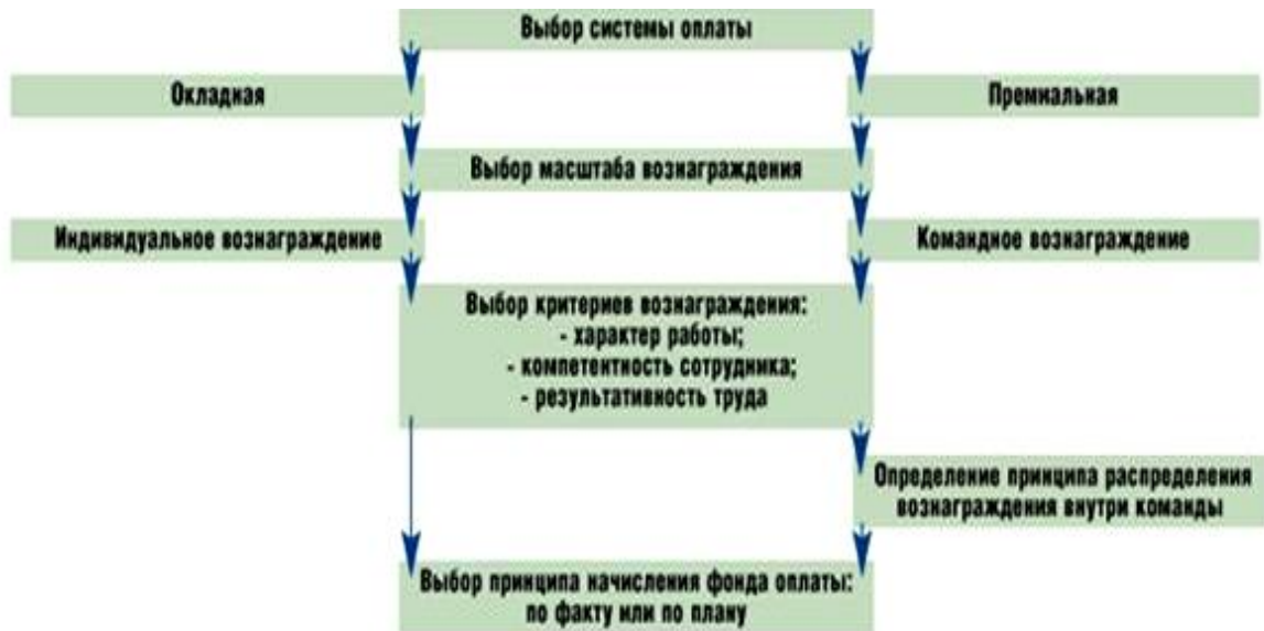
Рисунок 2. Алгоритм формирования системы материального стимулирования проектной команды

- информированность участников проекта – реализация проекта должна обязательно сопровождаться информированием всех заинтересованных лиц о содержании проекта, технологии его реализации, сроках, ответственности, системе мотивации.