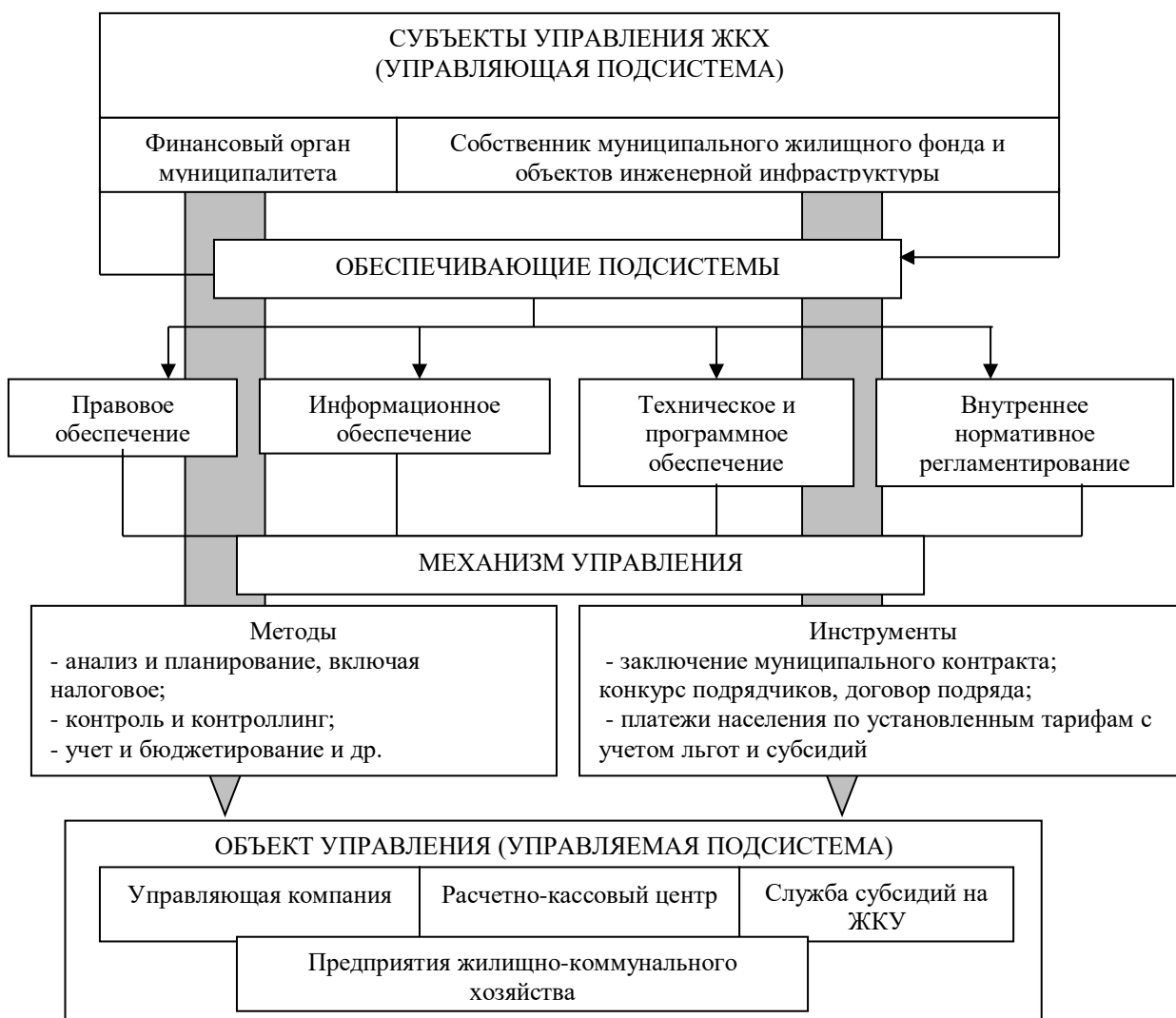
Рис. 1. Схема управления жилищно-коммунальным хозяйством на муниципальном уровне

Управление ЖКХ относится к ведению субъектов Российской Федерации и местного самоуправления, а участие государства заключается в нормативном регулировании, координации, контроле и обеспечении прав и законных интересов субъектов управления, определении приоритетов в структурной политике, лицензировании, регистрации и пр. Схема управления жилищно-коммунальным хозяйством на муниципальном уровне схематично изображена на рисунке 1.