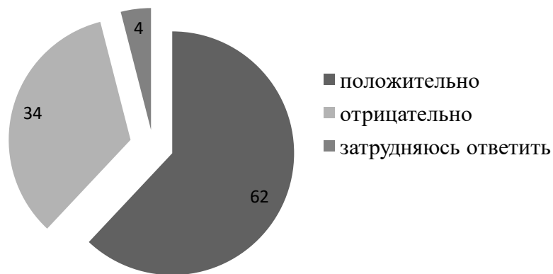
Рис. 4. Результаты ответов на вопрос «Как вы считаете, способствуют ли программы и проекты по развитию жилищно-коммунальному хозяйству в г. Белгороде повышению качества и расширению ассортимента жилищно-коммунальных услуг?» (в %)

Также необходимо отметить, что большинство опрошенных респондентов (74%) считают, что необходимо дальнейшее развитие проектов и программ в сфере ЖКХ г. Белгорода.