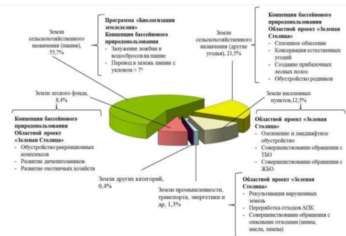
Рис. 1. Охват экологическими инициативами территории Белгородской области, %

Реализация государственной политики в области охраны окружающей среды, обеспечения экологической безопасности и рационального использования природных ресурсов, ориентированной на принципы устойчивого развития страны в целом и отдельных ее регионов, требует применения эффективной системы управления процессом принятия решений, в которой следует опираться на достоверную и своевременную информацию мониторинга поверхностных вод, об источниках антропогенного воздействия на них, о существующих и возможных последствиях этих воздействий 1 .