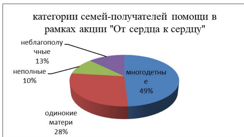
Диаграмма 1. Категории семей, получающих помощь в рамках акции «От сердца к сердцу», 2017 г.

В 2017 г. Управление социальной защиты населения Старооскольского городского округа организовало долговременную благотворительную акцию по сбору у населения вещей «От сердца к сердцу», чтобы помочь многодетным и малоимущим семьям. Таким образом, планировалось привлечь внимание общества к целому ряду острых социальных проблем, оказать конкретную помощь и, главное, создать в городе атмосферу сопричастности каждого человека к общим для всех проблемам. Акция началась в преддверии празднования Дня защиты детей и продлилась весь июнь. Всего было собрано около 1200 новых вещей. Основными получателями помощи стали многодетные и малообеспеченные семьи (Диаграмма)