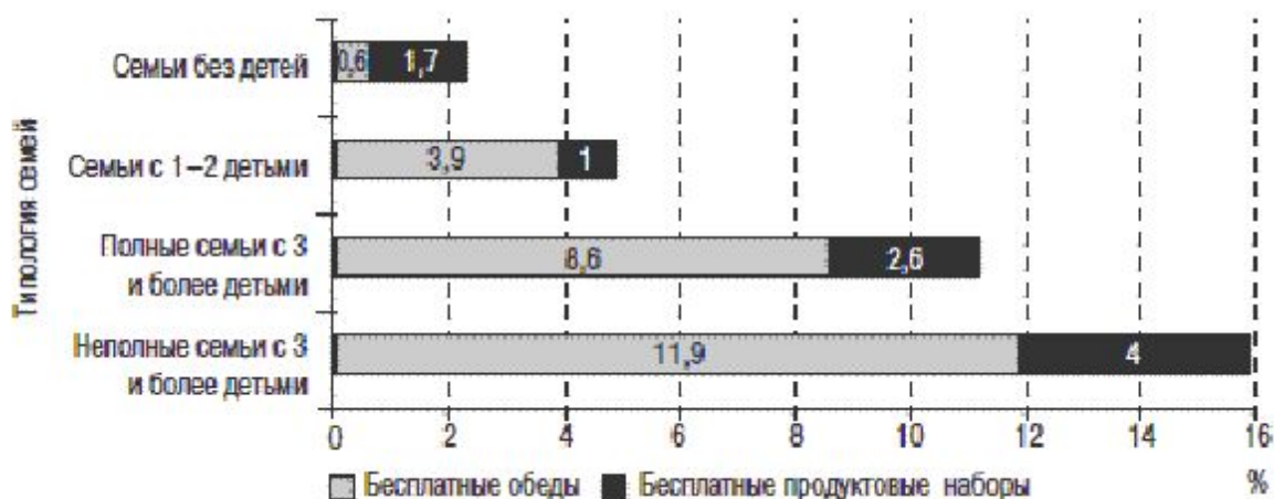
Рисунок 2. Доля домохозяйств, получающих бесплатные обеды и бесплатные продуктовые наборы в зависимости от категории домохозяйства, %

Завершая обзор программ поддержки многодетных семей, следует обратиться к проблеме регионального неравенства в доступе к ним. Анализ принятой в регионах системы мер социальной поддержки многодетных семей и ее динамика в последние несколько лет позволили выделить три типа региональной социальной защиты многодетных (Приложение 1).