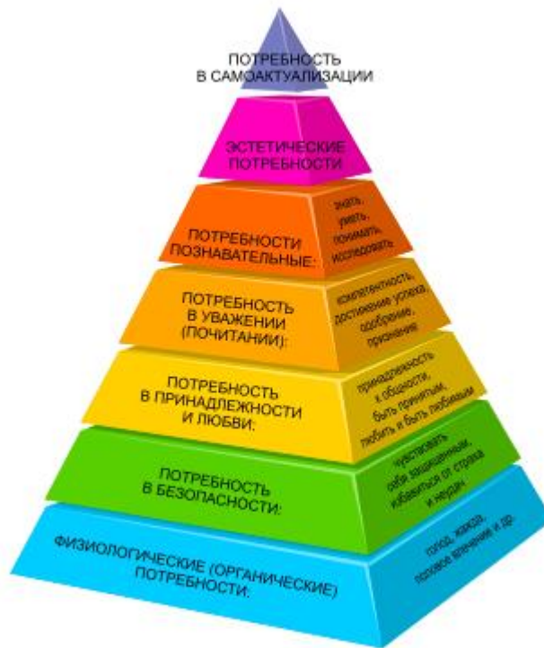
Рис. 1.1. Пирамида потребностей личности А. Маслоу

потребности высокого уровня, пока нуждается в более примитивных вещах.