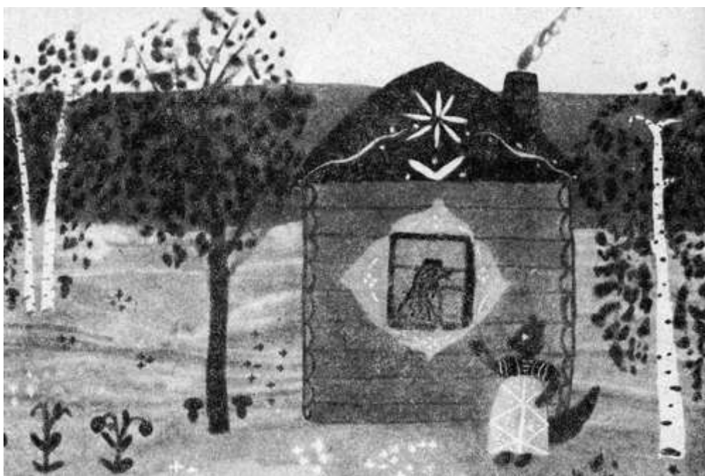
Иллюстрация к сказке «Лиса и петух». Рисунок дошкольника. Выделение смыслового и композиционного центра