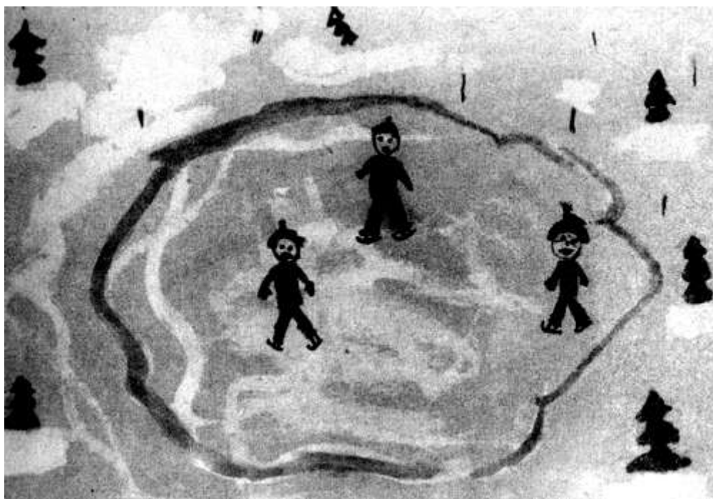
На катке. Рисунок дошкольника. Изображение с верхней точки зрения.