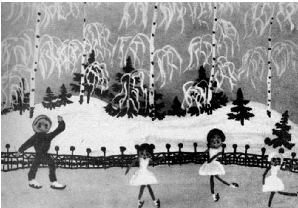
Юные фигуристы. Рисунок дошкольника. Многоплановое построение композиции