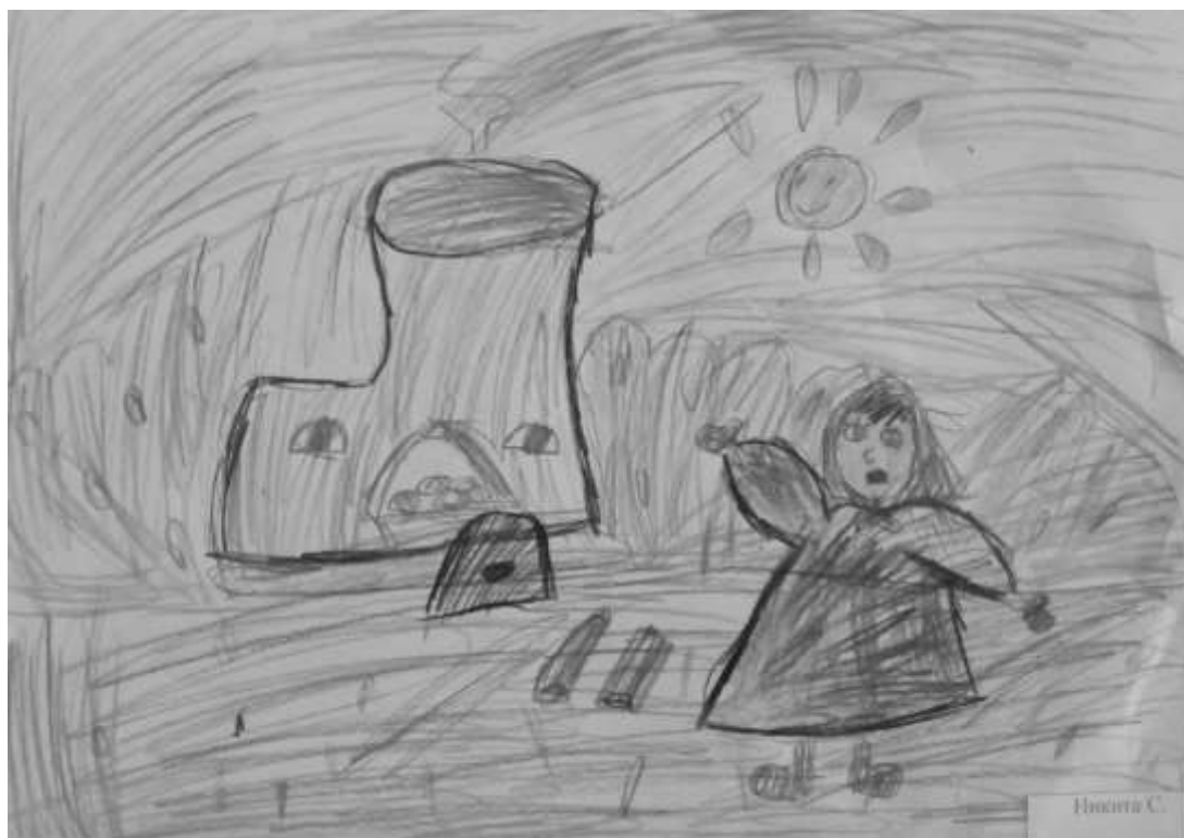
Рисунок детей старшего дошкольного возраста.