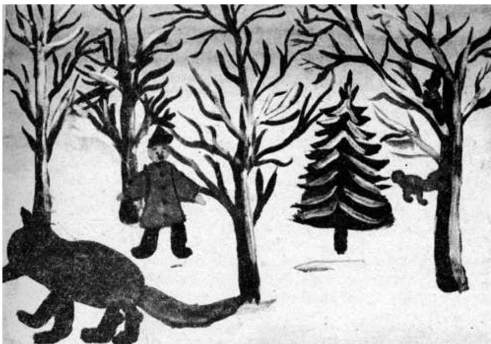
В зимнем лесу. Рисунок дошкольника. Асимметричное построение композиции. Применение перспективы в рисунке