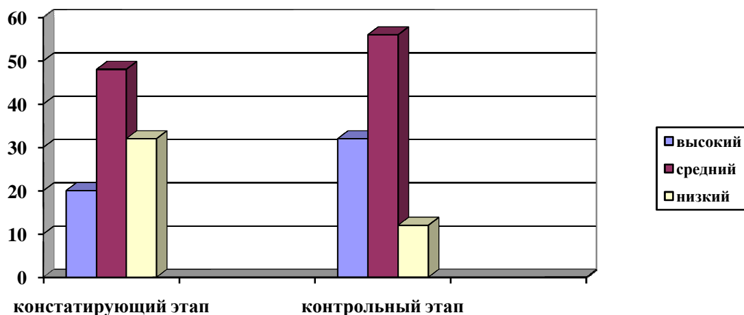
Рис. 2.2. Уровень нравственной воспитанности младших школьников на констатирующем и контрольном этапах экспериментальной работы

Динамика уровня нравственной воспитанности младших школьников на констатирующем и контрольном этапах экспериментальной работы показана на диаграмме (Рис. 2.2).