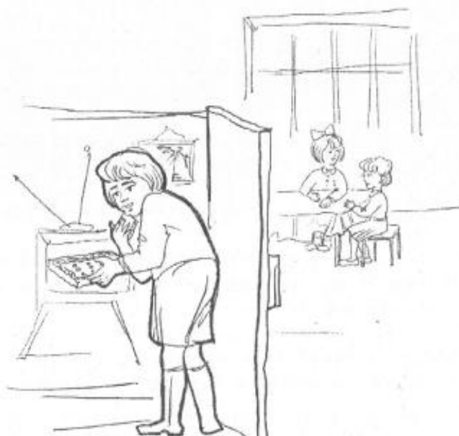
Рис. Щедрость – жадность.