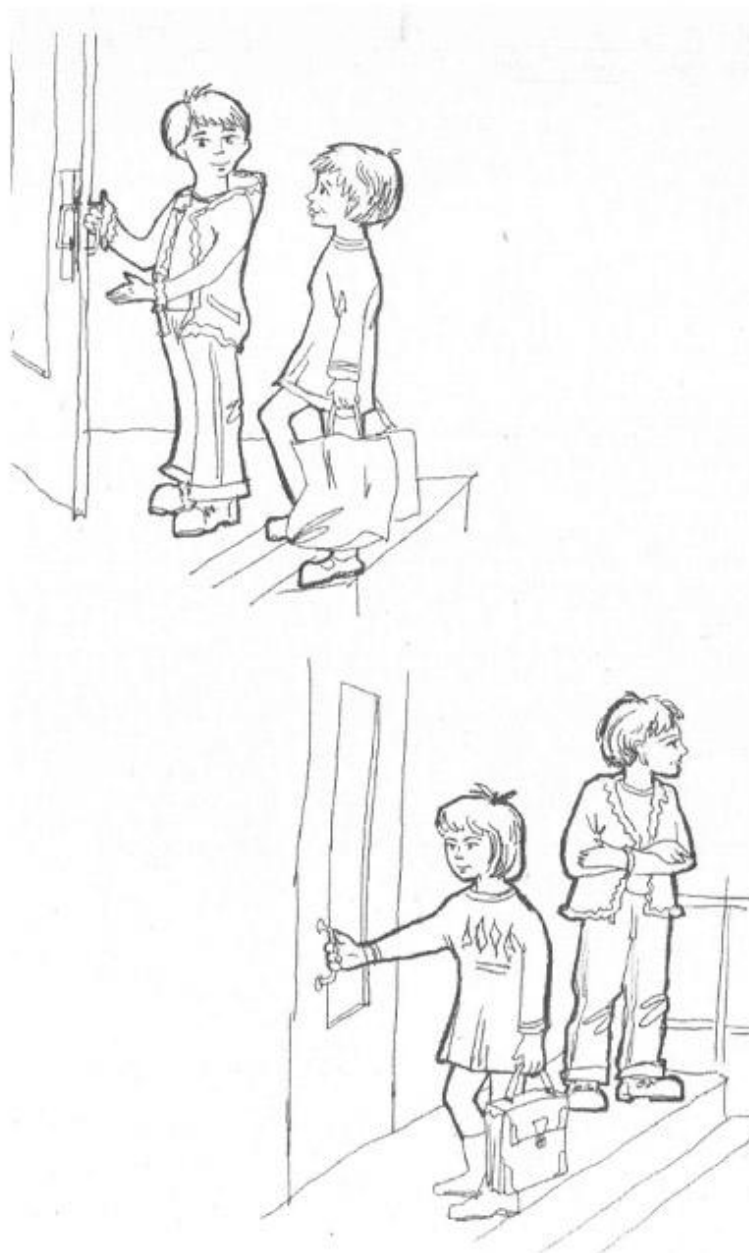
Рис. Вежливость – невнимательность.