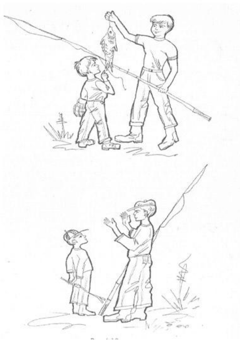
Рис. Правдивость – хвастовство.