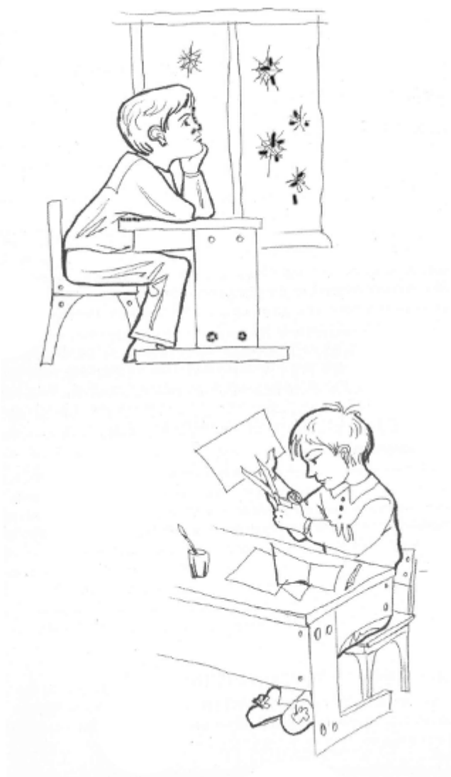
Рис. Бездействие – трудолюбие.