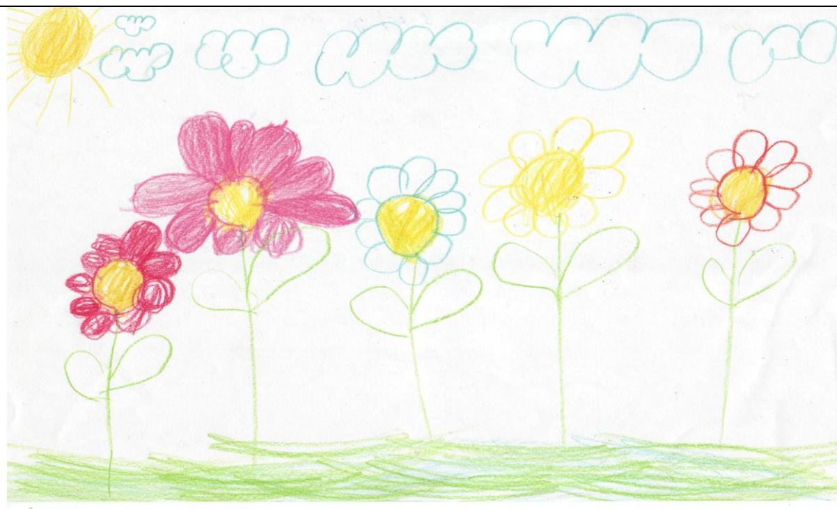
Цветочные клумбы в городе