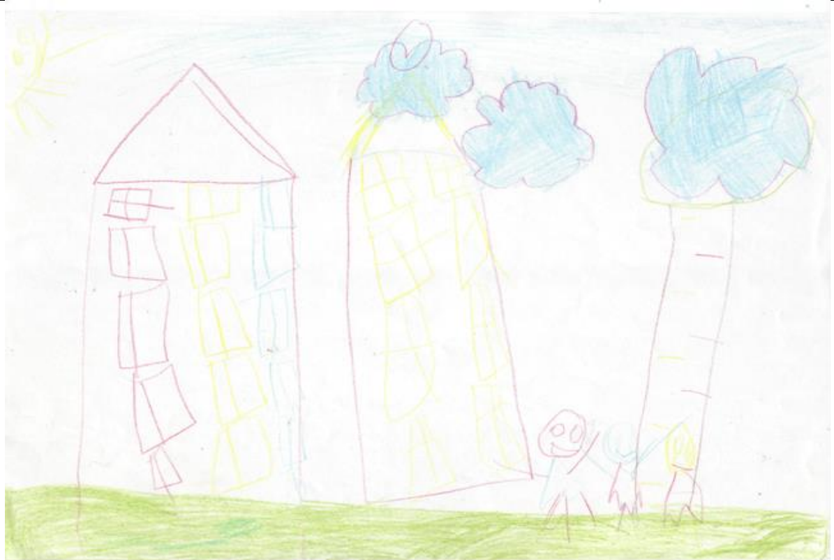
Мой дом и я с друзьями