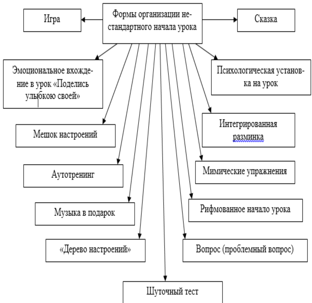
Схема «Формы организации нестандартного начала урока»