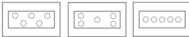
Рис. 1. Модели посадки ямок

На модели клумбы рاباتки дети карандашом рисуют ямки для посадки цветов. Важно, чтобы ямок было пять. Их расположение не имеет значения. Возможные варианты указаны на рис.1.