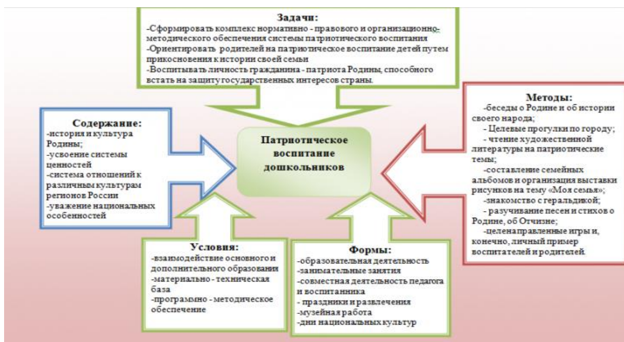
Рис. 1.1. Модель патриотическое воспитание дошкольников